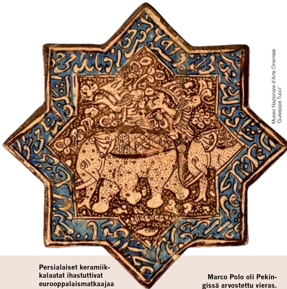
Museo Nazionale d'Arte Orientale Giuseppe Tucci