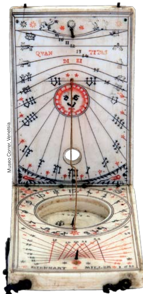
Museo Correr, Venetsia

Tutkimusretkeilijöiden aurinkokellojen piti olla taskuun mahtuvaa mallia.