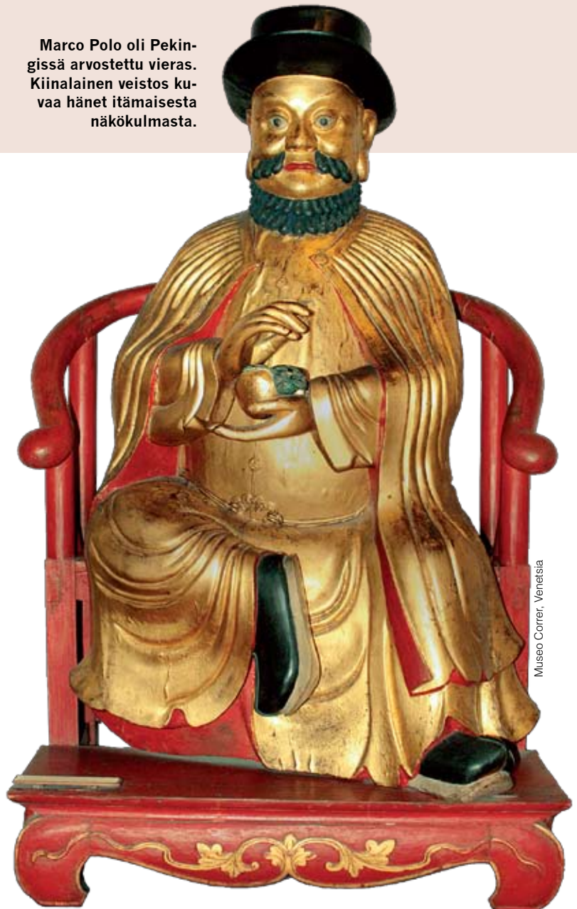
Museo Correr, Venetsia