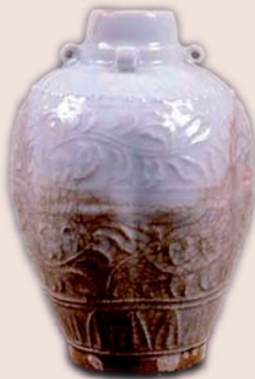
Kiinalaisen posliinimaljakon arvoitus jäi venetsialaisilta ratkaisematta.

Avainasemassa sekä valloitusretkillä että arkielämässä olivat hevoset. Pienikokoiset, sitkeät ratsut olivat liikkumis-