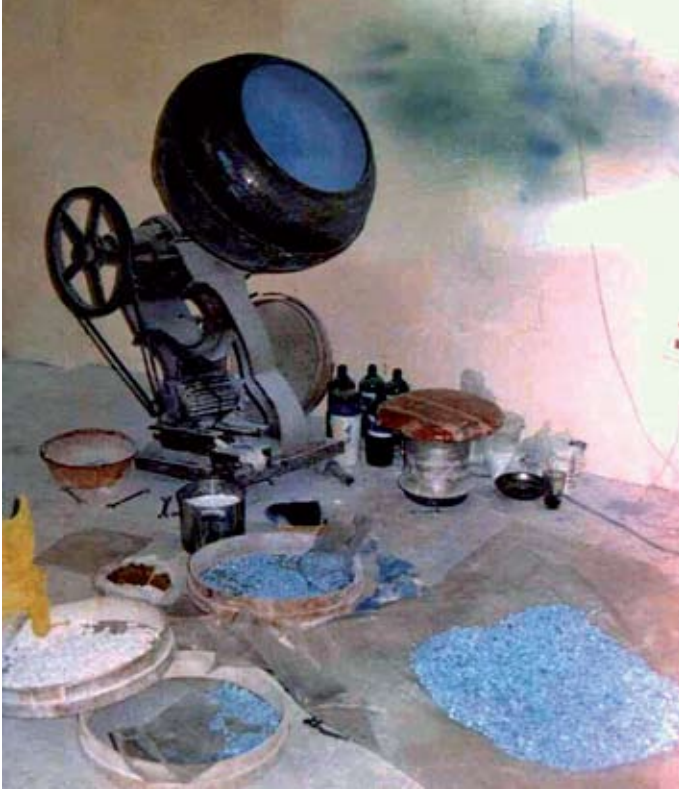
Egyptiläisyrittäjä värjasi tällaisessa myllyssä omakeoisia Viagra-tablettejaan.