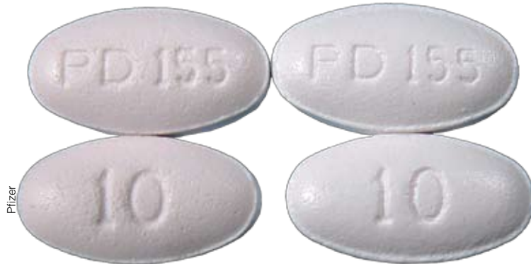
Kumpi on kumpi? Vasemmalla väärennettyjä, oikealla aitoja kolesterolilääkkeitä. Feikki-Lipitorit löydettiin Yhdysvalloista.

Kauppa se on joka kannattaa, ja pimeä lää-