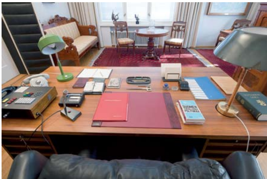
Urho Kekkonen hallitsi Suomea tämän pöydän takaa neljännesvuosisadan ajan.

Saamansa piti. Tamminiemeen hankittiin Yrjö Kukkapuron huonekaluja ja Marimekon kankaita. Myös materiaalit vaihtuivat nykyaikaisiksi. Sisustuksen monet yksityiskohdat olivat samoja, joita aikakauden tavallistenkin perheiden kodeista löytyi.