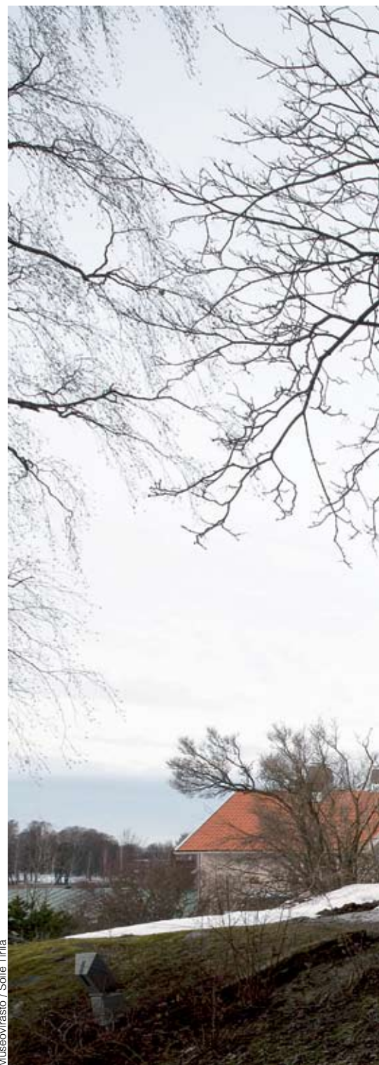
Museovirasto / Soile Tirilä