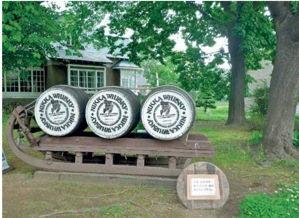
Nikka-tehtaan puistoalue on toteutettu japanilaisen estetiikan mukaisesti. Viski-tynnyriä on siroteltu museorakennusten väliin.

Nikkan perustajan Masataka Taketsurun suku oli tehnyt kuuluisaa riisiviiniä sakea jo parisataa vuotta, mutta nuorta kemistiä kiin-