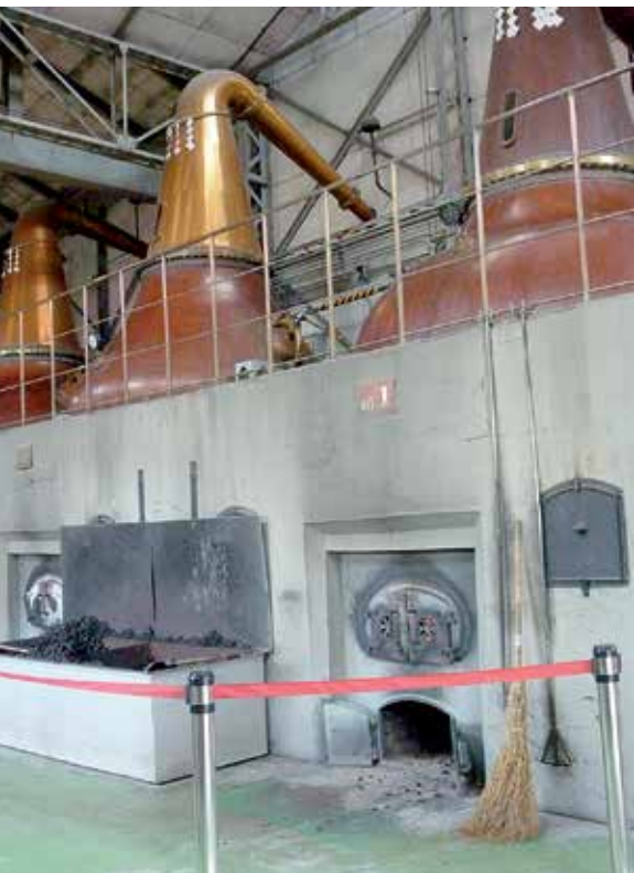
Nikka-tislaamon pannut lämmitetään vielä käsin kivihiilellä eikä automaattisesti sähköllä, kuten muualla on tapana.

nostivat viskin salat. Niinpä hän lähti vuonna 1918 Skotlantiin.