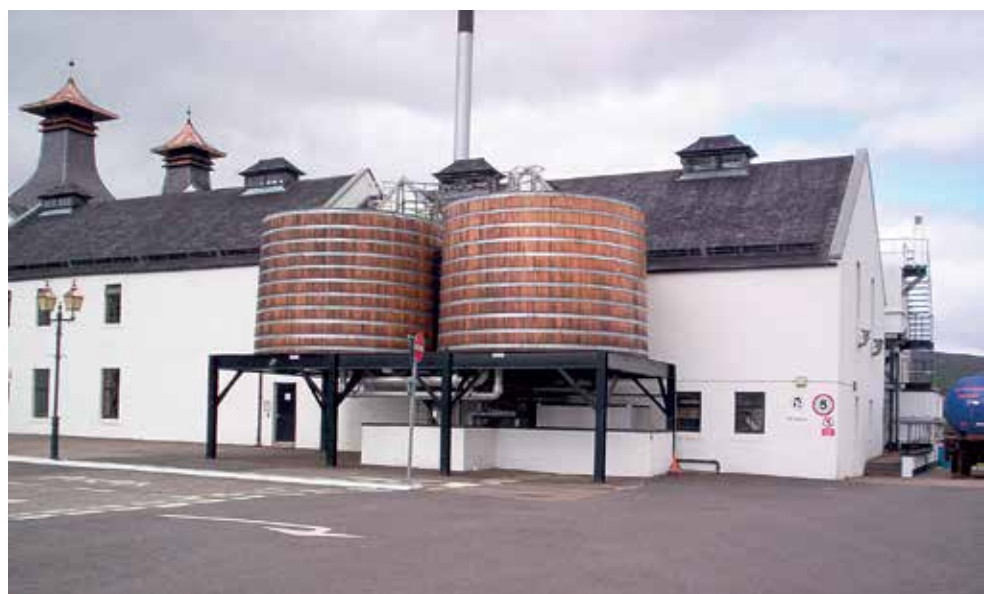
Ylämaiden Dalwhinnie on korkeimmalla toimiva tislaamo Skotlannissa. Vaeltaja erottaa jo kaukaa tislauspannujen yläpuolella sijaitsevat pagoda-tornit.

Barran naapurisaaren Eriskayn edustalla sumussa haaksirikkoutunut laiva oli nimeltään S/S Politician . Sen lastina oli yhteensä 260 000 pulloa erimerkkisiä viskejä, jotka olivat matkalla Yhdysvaltoihin Britannian maksuna sotatarvikkeista.