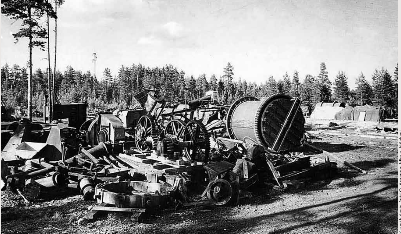
Kuvat kirjasta Antti O. Arponen: Minun Jääskeni

Outokummun kuparisulaton koneita ja laitteita evakkomatalla. Tehdas siirrettiin jatkosodan loppuvaiheissa itärajalta Harjavaltaan.