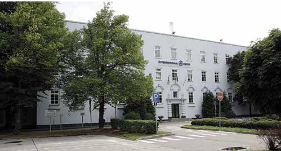
Entinen Enso-Gutzeitin pääkonttori 1930-luvulta toimii nykyisin International Paperin omistaman OAO Svetogorskin hienopaperi- ja kartonkitehtaan päämajana.