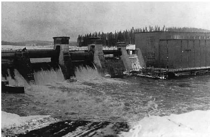
Karjalan teollisuudelle jauhoi energiaa Rouhialan kosken vesivoimala.