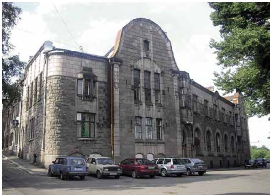
Hackmanit olivat Karjalan merkittävimpiä teollisuusvaikuttajia. Hackmanin kauppahuoneen komea rakennus on yhä Viipurin maamerkkejä.