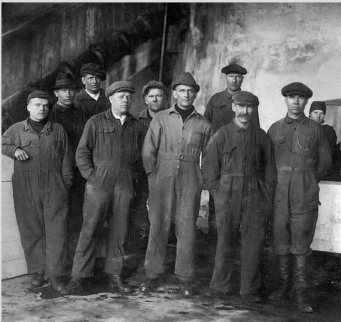
Enson teollisuusyhdyskunta Jääskessä oli luovutetun Karjalan vilkkaimpia. Tehtaat tarjosivat leivän niin miehille kuin naisillekin.

■ Viime sodissa menetetyssä Karjalassa toimi noin 450 teollisuuslaitosta. Hävityn sodan jälkeen ne jouduttiin luovuttamaan Neuvostoliitolle.