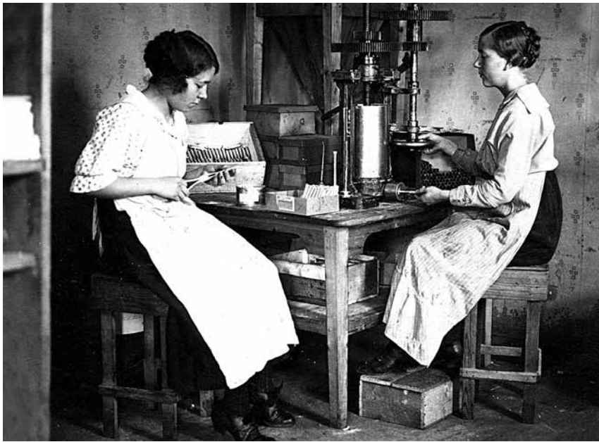
Suomen Kerta Oy