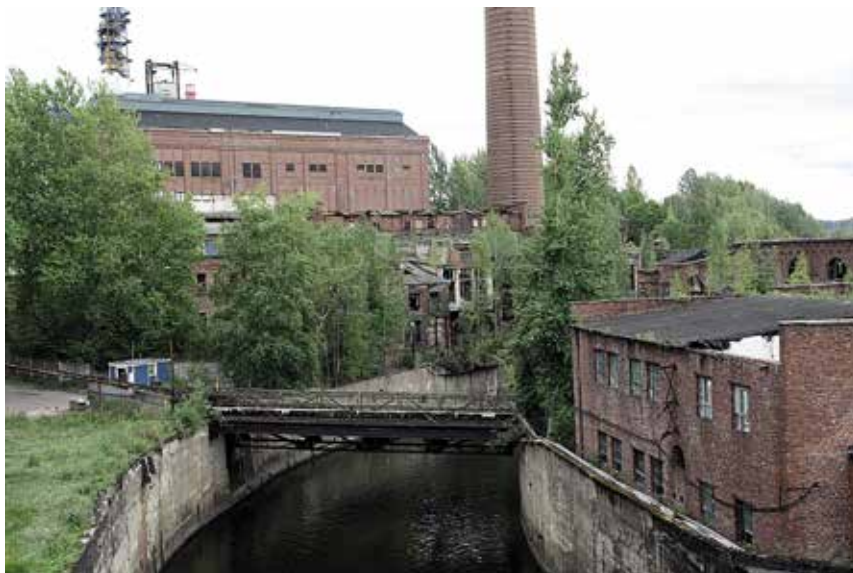
Enson tehdasalue henki 1930-luvulla kasvua ja vaurautta.