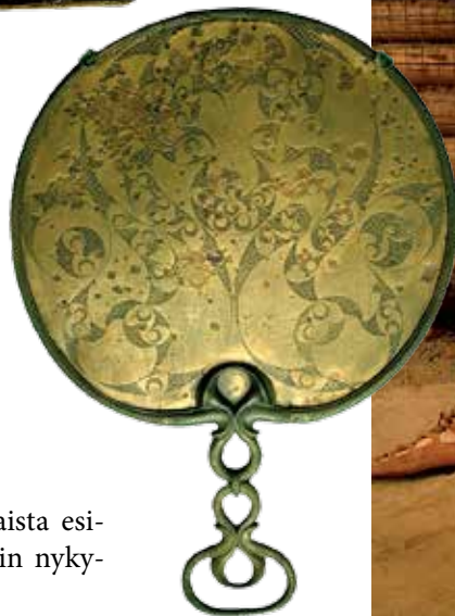
Pronssinen keltti-peili ajanlaskun alusta.

Keltit hallitsivat kaikkien metallien taonnan. Kultainen kypärä on noin vuonna 350 eKr. syntynyt taideteos.