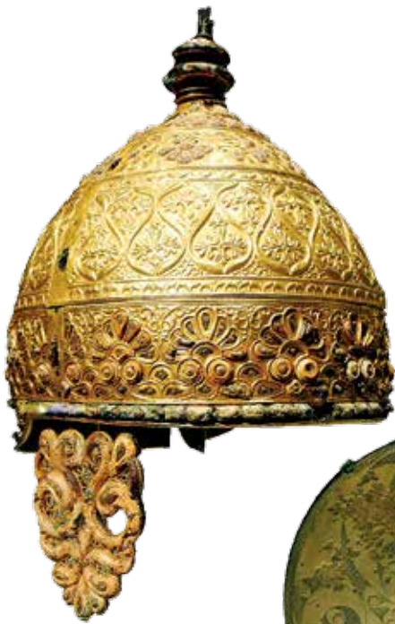
Näin pukeuduttiin La Tèneä. Rekonstruktio on puolalaisesta museosta.

Keltit hallitsivat kaikkien metallien taonnan. Kultainen kypärä on noin vuonna 350 eKr. syntynyt taideteos.