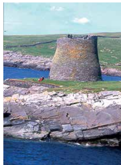
Skotlannissa kohoavan yli 2000-vuotiaan Mousan tornin rauniot muistuttavat kelttien menestyksekkästä puolustustaistelusta roomalaisia vastaan.