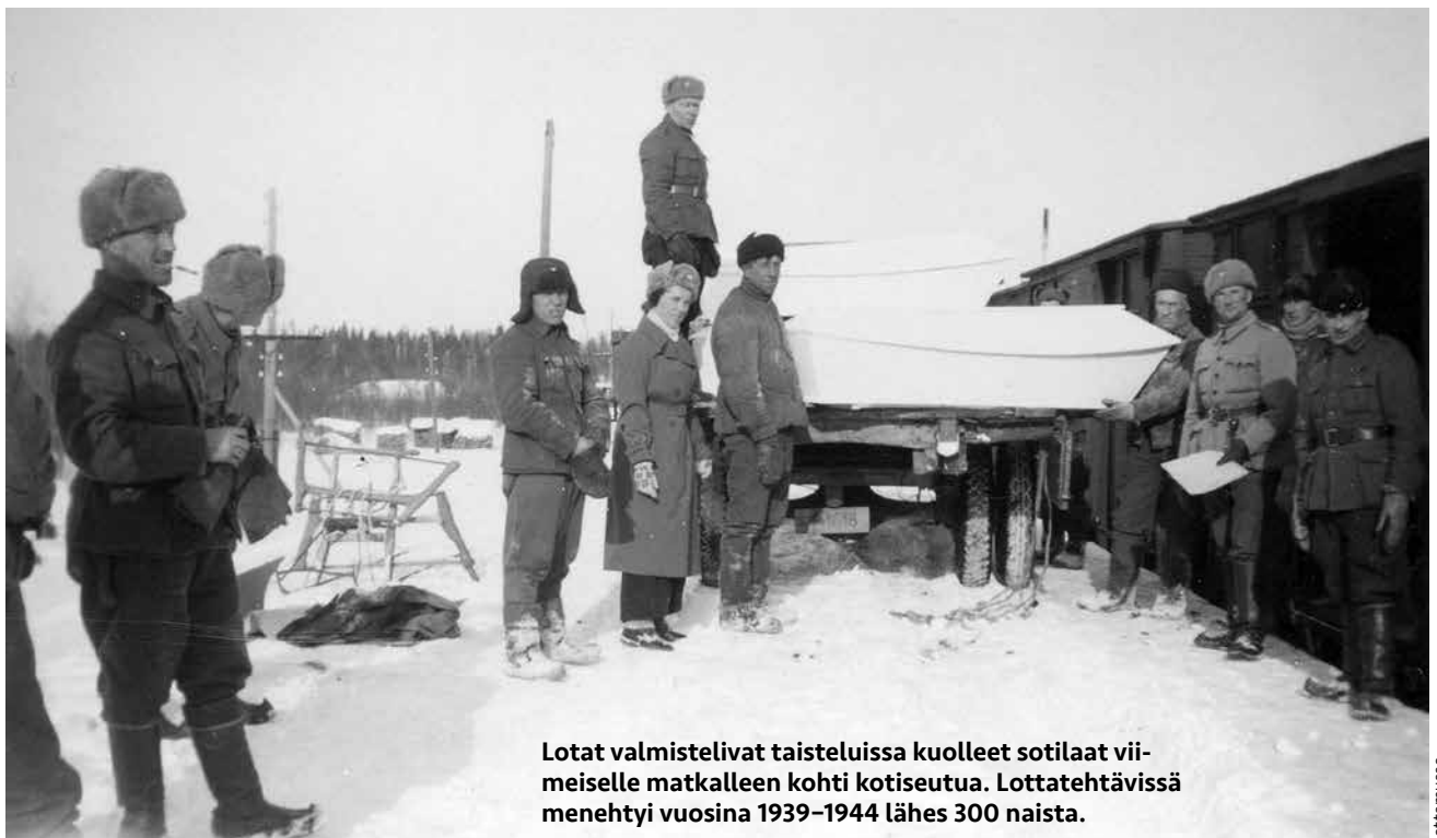
Lotat valmistelivat taisteluissa kuolleet sotilaat viimeiselle matkalleen kohti kotiseutua. Lottatehtävissä menehtyi vuosina 1939–1944 lähes 300 naista.