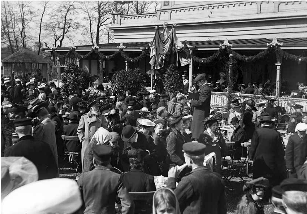
Suosittuun ravintolaan ja sitä ympäröivään puistoon kerääntyi väkeä etenkin erilaisina juhlapäivinä.